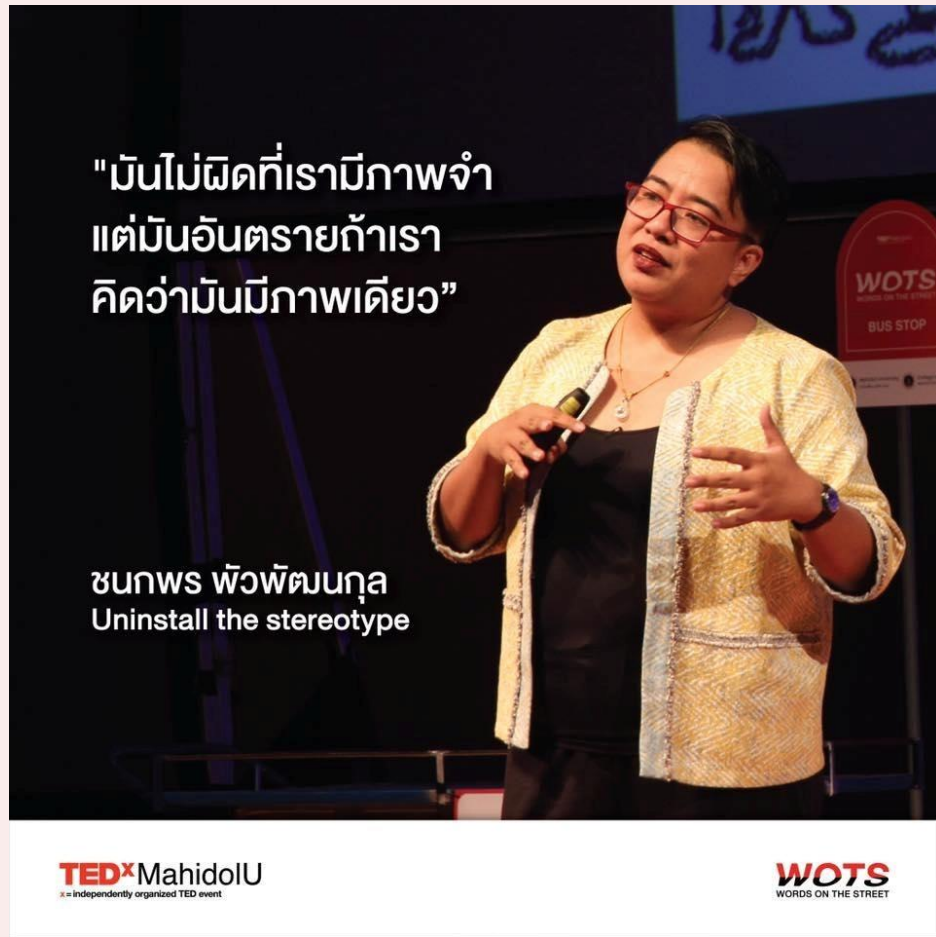
The Art of NOT Believing | ดร.ชนกพร พัวพัฒนกุล | TEDxMahidolU